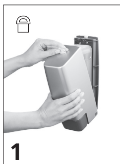
1 Öppna dispensern.