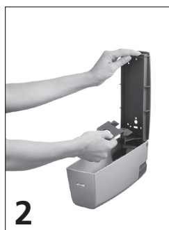
2 Ta bort de gamla plattorna.