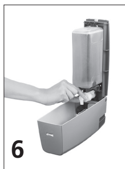
6 Öppna pumpen genom att vrida ventilen så den pekar nedåt.