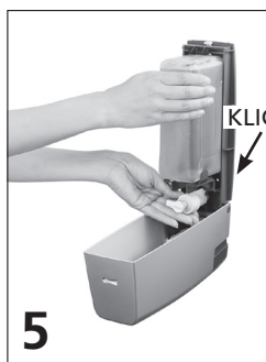
5 Installera tvålpatronen. Tryck tills det klickar.