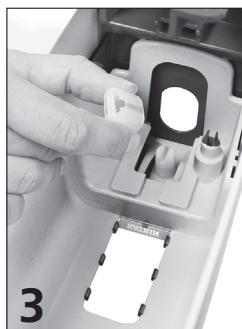
3 Ta bort plastdetaljen. Om den är hal, använd tång eller skruvmejsel.